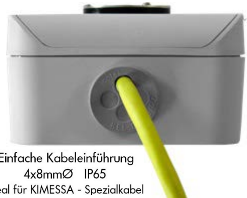
Einfache Kabeleinführung 4x8mmØ IP65 Ideal für KIMESSA - Spezialkabel

Ausgänge: 3 potentialfreie-Relaiskontakte (maximal 2A) RESET Fernanschluss: Fernanschluss für einen externen Reset-Taster Digital-Anschluss: KIMESSA-CanBus